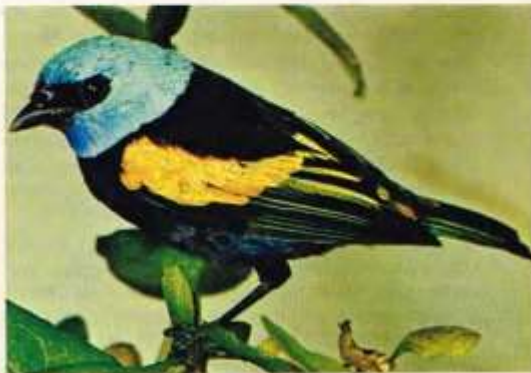
De blauwe tangara

Reeds sedert juli '68 zitten 3 blauwkoptangara's (2 „gewone” en 1 „geelschouder”) tezamen in één van mijn voliëres. De 3 exemplaren behoren tot de ondersoorten: T.c. cyanicollis , caeruleocephala en cyanopygia . Het samenleven verloopt echter niet zo vlot. Twee vogels horen blijkbaar beter bij elkaar (1 gewone + 1 geelschouder) en de derde gewone blauwkop vormt zowat het „zwarte schaap”. Nu en dan, zelfs buiten hun normale broedseizoen, treden er ernstige „meningsverschillen” op, zodat er wel eens gevochten wordt. Maar naast deze sporadische goedaardige vechtpartijen, beperkt alles zich