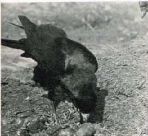
Roek pikte zijn deel, rechts boven loert een naijverig kauwtje.

blijkt duidelijk dat onder „Schavuiten" (wit-zwart) als meeuwen en kraaien wel „afgunst" bestaat.