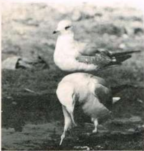
De achterste stormmeeuw heeft het hart in zijn lijf niet een pik te wagen voor meneer „Zilver" klaar is.

Meneer de Uil met zijn fabeltjeskrant beweert avond en avond via de beeldbuis, dat vogels net als mensen zijn. Zij hebben dezelfde wensen en ook dezelfde streken. Nou geloof ik niet dat die „wijze" meneer de Uil helemaal gelijk heeft. Maar als er hier of daar in het veld, al of niet voorzien van een bordje verboden toegang, een „vette klui" ligt, dan