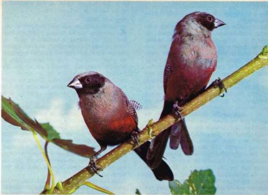
Ook straks de effen-astrilde niet?